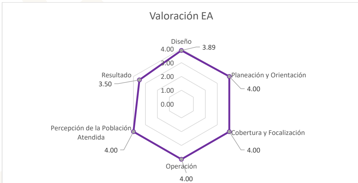
Ilustración 2 Valoración Final del FAETA EA